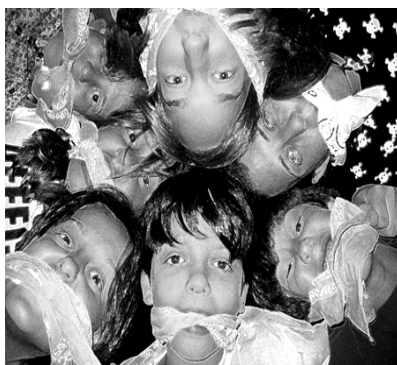
Una instantánea bonita de los preadolescentes de la Parroquia del Santísimo Redentor de Sevilla. ¡Vaya piezas!